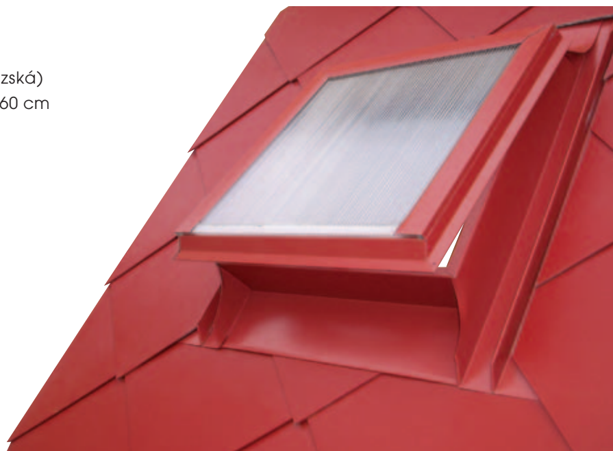
Střešní výlez HPI - STANDARD do hladké střešní krytiny (CEMBRIT)