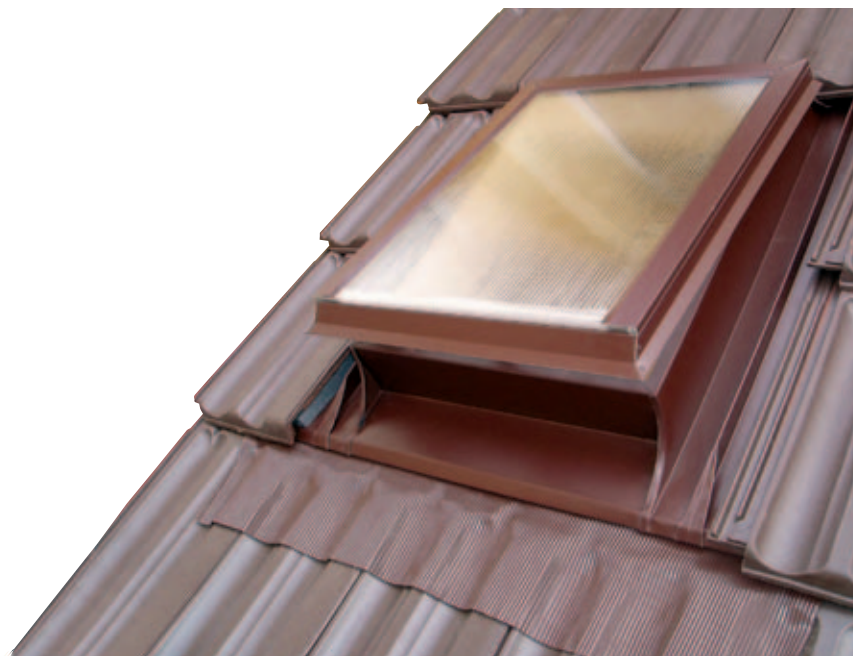
Střešní výlez HPI - UNIVERZÁL do profilované střešní krytiny

Dřevěný rám Plisovaný olověný pás v barvě okna Molitanové těsnicí klíny Přizové těsnění v rámu okna