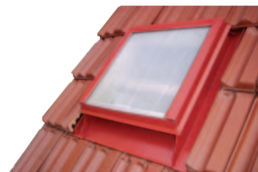
V krytině FRANCOUZSKÁ