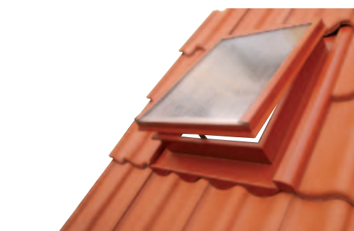
V krytině BRAMAC MORAVSKÁ