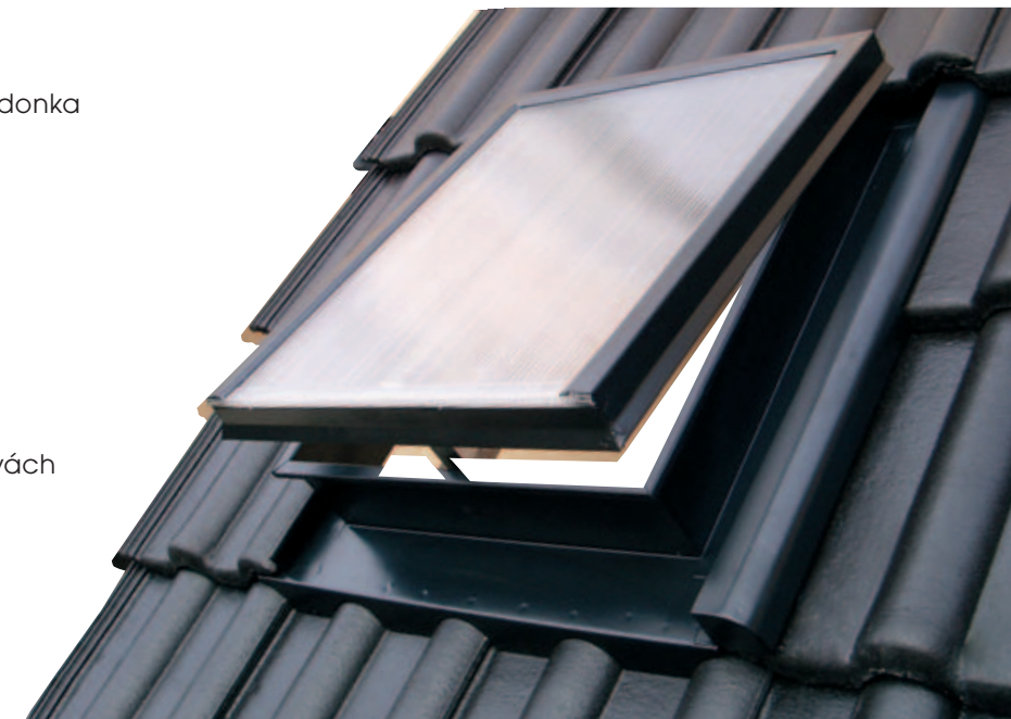
Střešní výlez HPI - SPECIÁL v krytině KM BETA (černá)