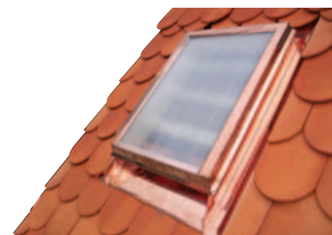
V krytině BOBROVKA