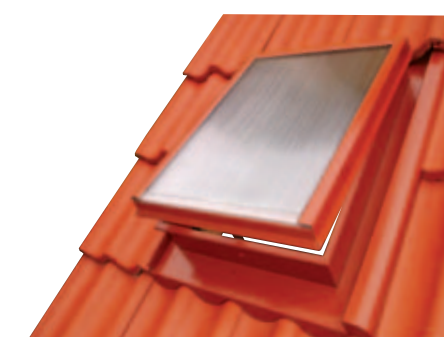
V krytině BRAMAC MAX

Polohovací vzpěra (u všech typů Standard, Speciál, Univerzál)