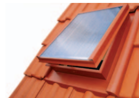
V krytině BRAMAC ALPSKÁ