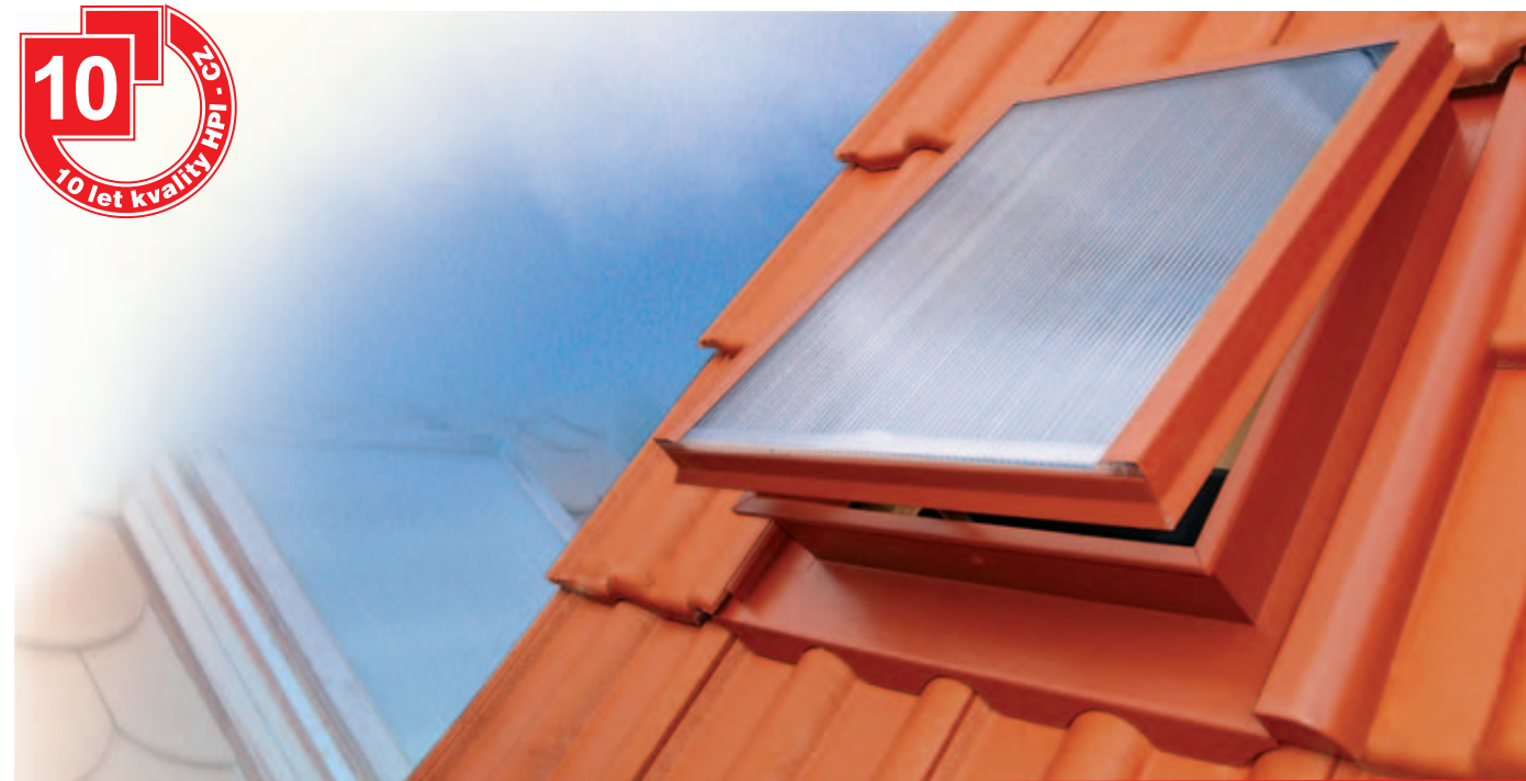
Střešní výlez HPI - SPECIÁL tvarovaný pro KM BETA HODONKA